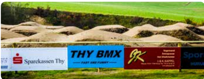
Thy BMX med 323 meter bane