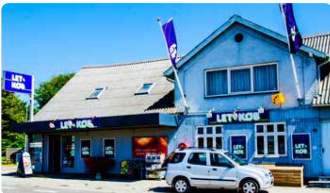
Længe leve købmanden

I katolsk tid var kirken viet til Sankt Morten. En tidligere indgang i tårnets vestside har siden 1929 været ligkapel.